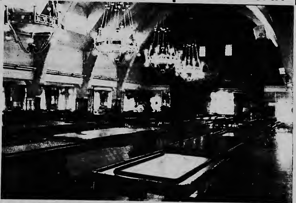
Esaki ta e salon principal di Casino San Rafael na Punta del Etse, caminda presidentenan Americano lo reuni di dia 12 te 14 di april proximo. Te awor aki e sala ta yen di mesanan di wega di placa pero nan lo saca tur afor pa e combersacionnan en cuestion.